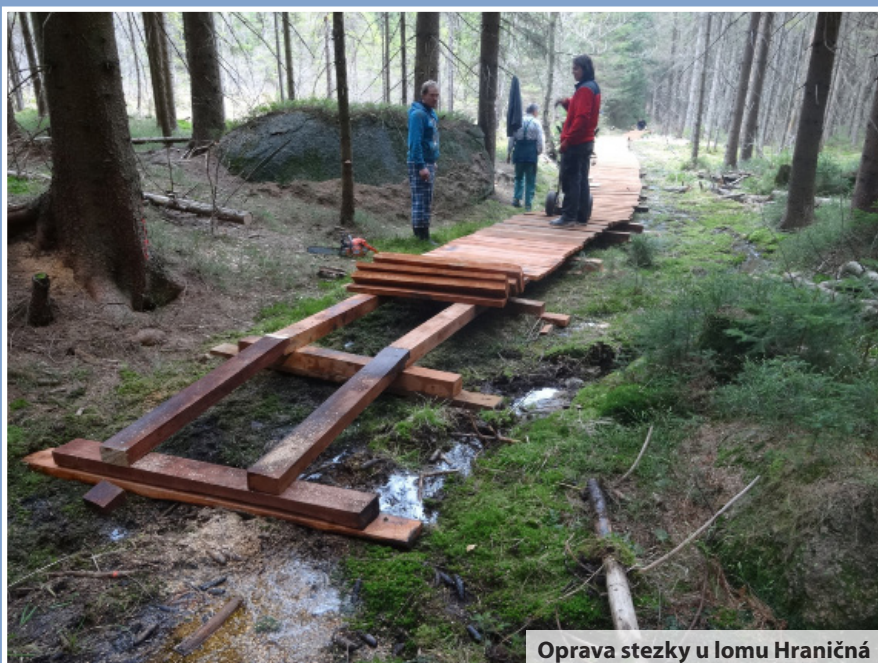
Oprava stezky u lomu Hraničná