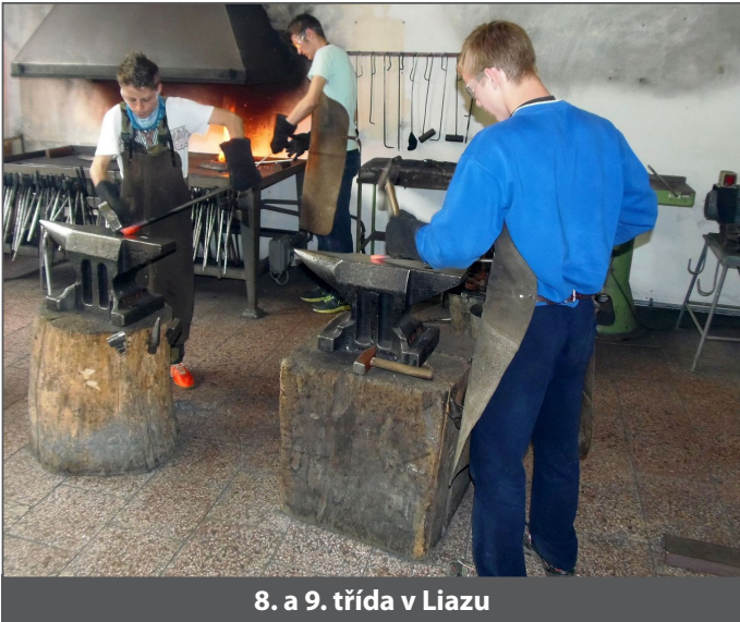
8. a 9. třída v Liazu