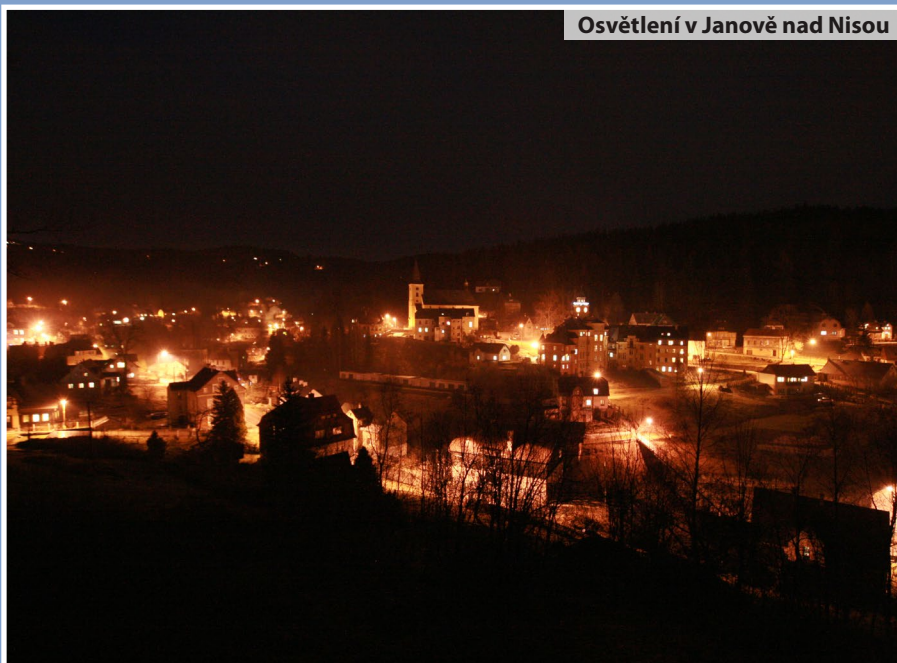
Osvětlení v Janově nad Nisou