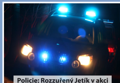
Policie: Rozzuřený Jetík v akci