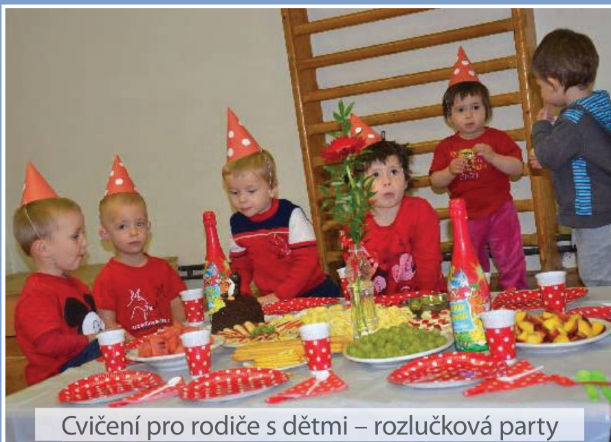
Cvičení pro rodiče s dětmi – rozlučková party