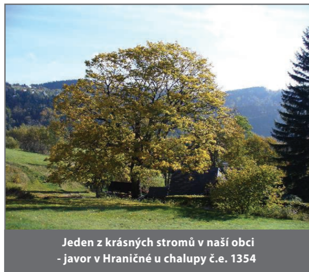
Jeden z krásných stromů v naší obci - javor v Hraničné u chalupy č.e. 1354

Zákon ukládá vlastníkům povinnost pečovat o stromy. Vždy je lepší pokusit se nejprve o vhodné ošetření stromu, než rovnou uvažovat o jeho pokácení. Starý strom má svou hodnotu, která pokácením navždy zmizí. Na citlivou péči o staré stromy je možné získat finanční prostředky, např. z Programu péče o krajinu.