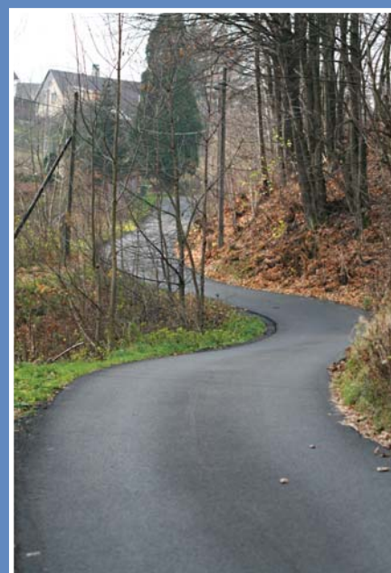
Fotografie k článku „Slovo starosty“ Cesta na Vyšehrad

služebna: Janov nad Nisou, budova radnice, vedle hlavního vchodu vpravo