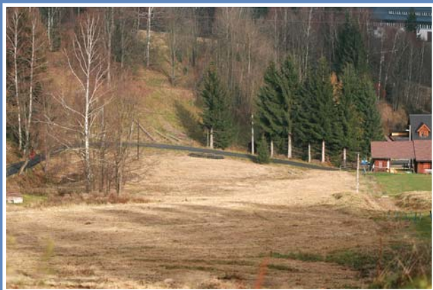
Cesta okolo Kačáku