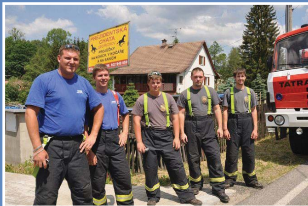
Členové SDH Janov nad Nisou